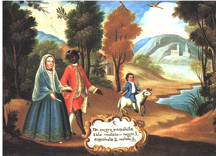
“De negro y española sale mulato”. Exemple de ‘pintura de castas’ mexicaines (Emery College, USA).