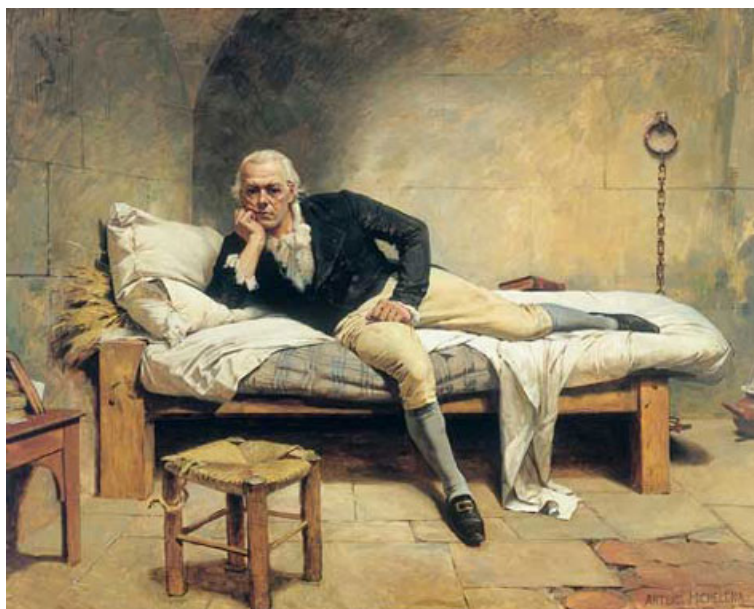
Arturo Michelena, « Miranda en la Carraca », Galería de Arte Nacional, Caracas.