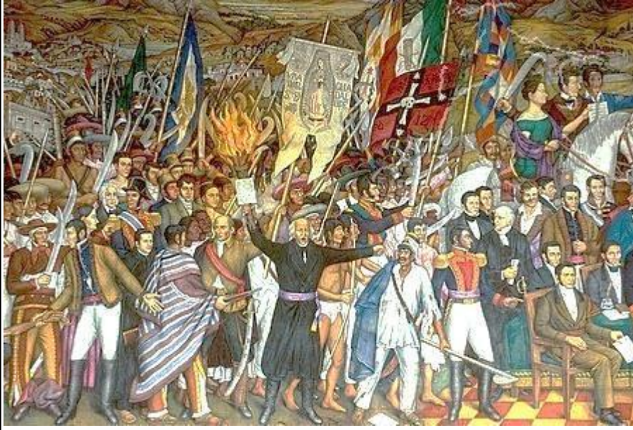
Grito de Dolores – Mural de Juan O'Gorman