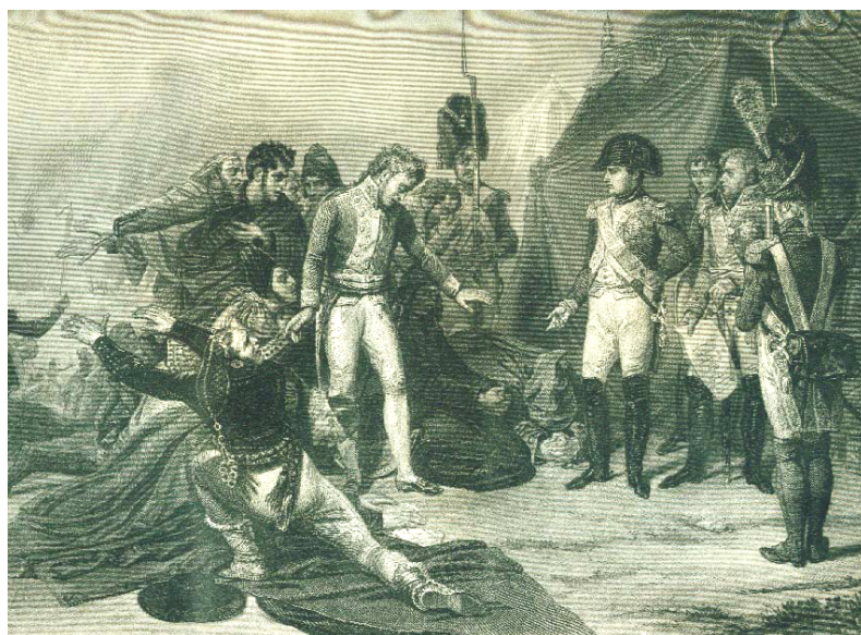
Capitulation de Madrid 4.Décembre 1808 Gravure sur cuivre. Paris c.1830