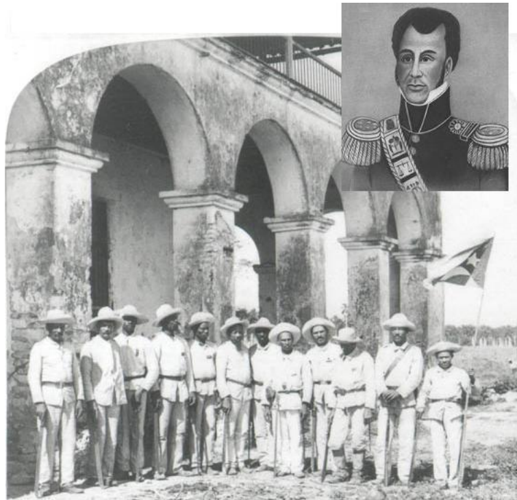
« Soldiers Mambi », Library of Congress (Washington D.C., Etats-Unis); Portrait de Jean-Pierre Boyer, n.d.