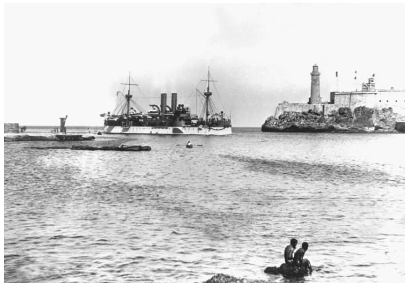
“The Maine entering Havana Harbor”, 25 Jan. 1898. Library of Congress (Washington D.C., Etats-Unis), cote LC-D4-20520